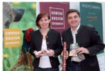
Genussregion Weinviertler Wild