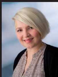
Bianca Lutz Projekte & Grafik