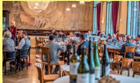
Masterclass Weinviertel, München

Das Restaurant Prinzpal im Prinzregententheater in München war der ideale Ort für die Masterclass zur Vorstellung des Weinviertels und seiner Weine. 9 Weinviertel DAC Reserven wurden im Vergleich mit 9 Topweinen aus Italien, Deutschland und Frankreich verkostet.