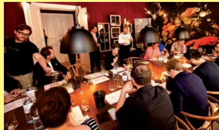
Masterclass Weinviertel, Cordobar Berlin

In der berühmten Cordobar in Berlin wurden 9 Weinviertel DAC Reserven im Vergleich mit 9 Topweinen aus Italien, Deutschland und Frankreich verkostet.