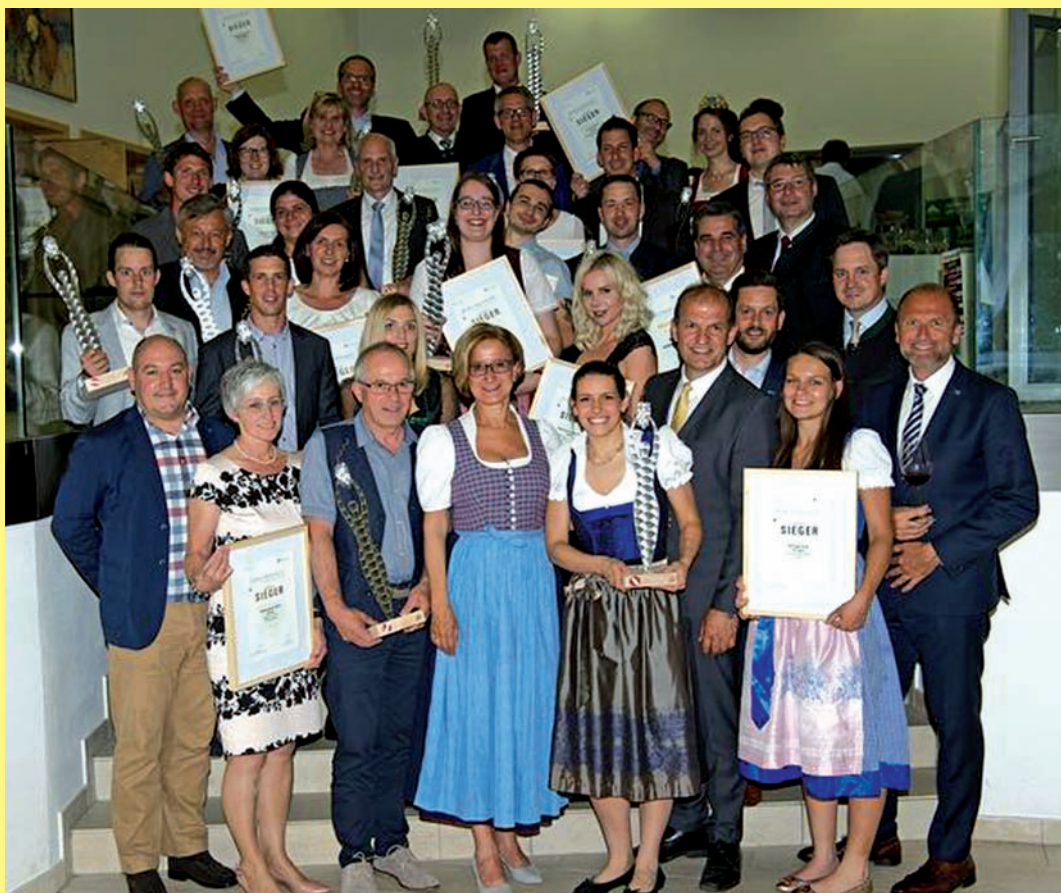
30. Landesweinprämierung: Gradmesser für Weinqualität in Niederösterreich erfreut sich zum Jubiläum immer größerer Beliebtheit