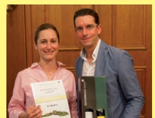
Stipendien für zwei tschechische Studenten der Weinakademie Österreich