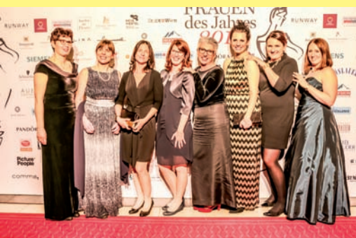
Acht Gewinnerinnen sorgten für einen großen Auftritt des Weinviertler Weins.