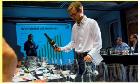
Masterclass Weinviertel, Warschau

17 Weinviertler Weine wurden 30 Experten aus Polen in der modernen Location „Winosfera“ präsentiert.