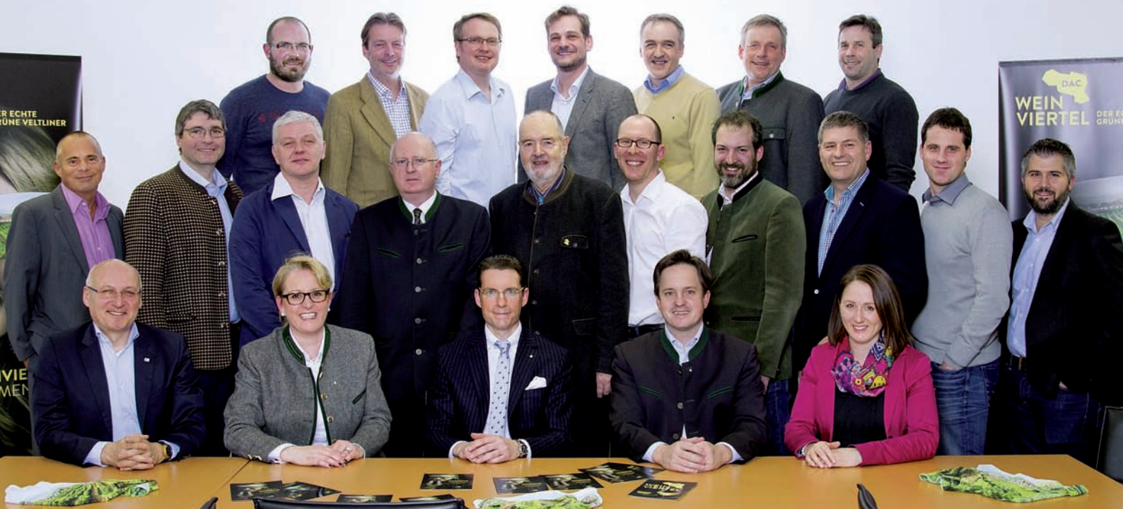
Das Regionale Weinkomitee Weinviertel mit dem Präsidenten des Österreichischen Weinbauverbandes Abg. z. NR Johannes Schmuckenschlager