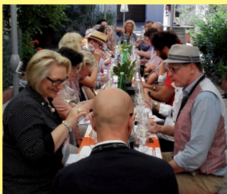
Deutsche Sommeliers beim Verkosten im Weinviertel